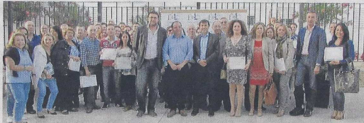
Foto de familia del medio centenar de asociaciones que se beneficiarán de las ayudas.

● El programa, que se instauró en 2012, prevé incentivos de 30.000 euros en cada caso