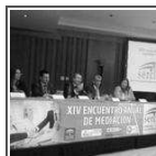
El SERCLA celebró su XIV Encuentro anual de mediación