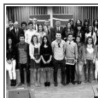
Récord de becas concedidas por la Fundación Atlantic Copper a alumnos de la UHU