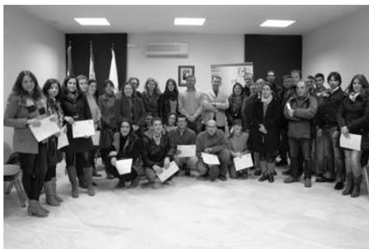
Entrega de ayudas a emprendedores

Juntos moldearon el llamado Plan de Desarrollo Municipal, que engloba todo un conjunto de iniciativas financiadas por la Fundación Cobre Las Cruces y que responden principalmente al fomento del emprendimiento, a la creación de empleo y formación profesional y a la mejora de las infraestructuras locales de diversa naturaleza. También recoge el patrocinio de distintos tipos de eventos y actividades de carácter social y solidario, cultural, musical, deportivo o relacionados con el ocio y entretenimiento de pequeños y mayores de los cuatro municipios.