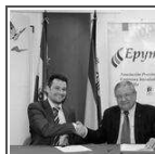
Gas Natural Andalucía y Epyme firman un convenio