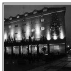
Enel Sole y Endesa se adjudican el contrato de iluminación pública de Móstoles